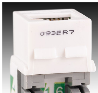
Bebidas — plástico