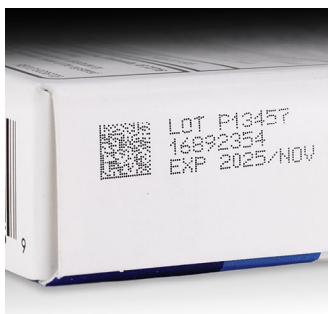
Farmacêutico – papelão