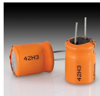
Componentes eletrônicos – plástico