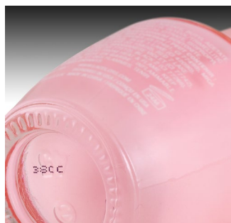
Extrusão — plástico